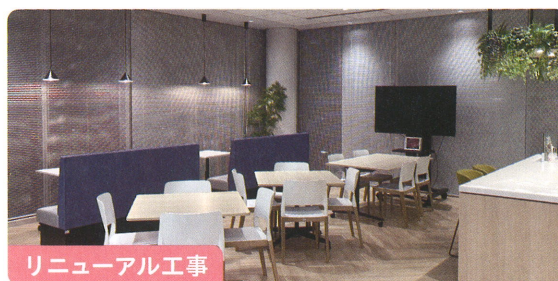
リニューアル工事